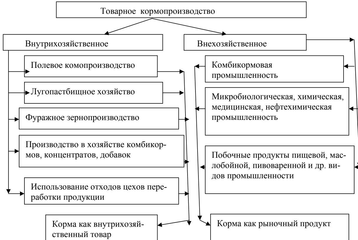
Рис.2. Структура товарного кормопроизводства

В условиях переходного периода, когда сформированные ОАО, ООО, ЗАО, ССК, ЧП и другие сельскохозяйственные предприятия, сохранили достаточную крупность производства, но находятся в трудном финансовом положении и многие из них не могут покупать рыночные корма , резко упало промышленное производство комбикормов , кормовых добавок.