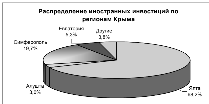
Рис. 2. Распределение иностранных инвестиций по регионам Крыма.

Рассматривая распределение инвестиций по городам АРК, следует отметить, что наибольший удельный вес внешних инвестиций приходится на Ялту, Алушту, Симферополь и Евпаторию, которые являются территориями приоритетного развития. Наиболее активно инвестиционная деятельность развивается в Ялте. Так, в 2002 году предприятия инфраструктуры, туристические предприятия, санаторно-курортные учреждения города Ялты получили 127,8 млн. долл., что составило 68,2% от общего объема инвестиций в Крыму. В других городах Крыма инвестиции распределены следующим образом: Симферополь – 38,4млн.долл., (19,7%); Евпатория – 10,3 млн.долл. (5,3%); Алушта – 5,9млн.долл. (3,0%). [Рис. 2].