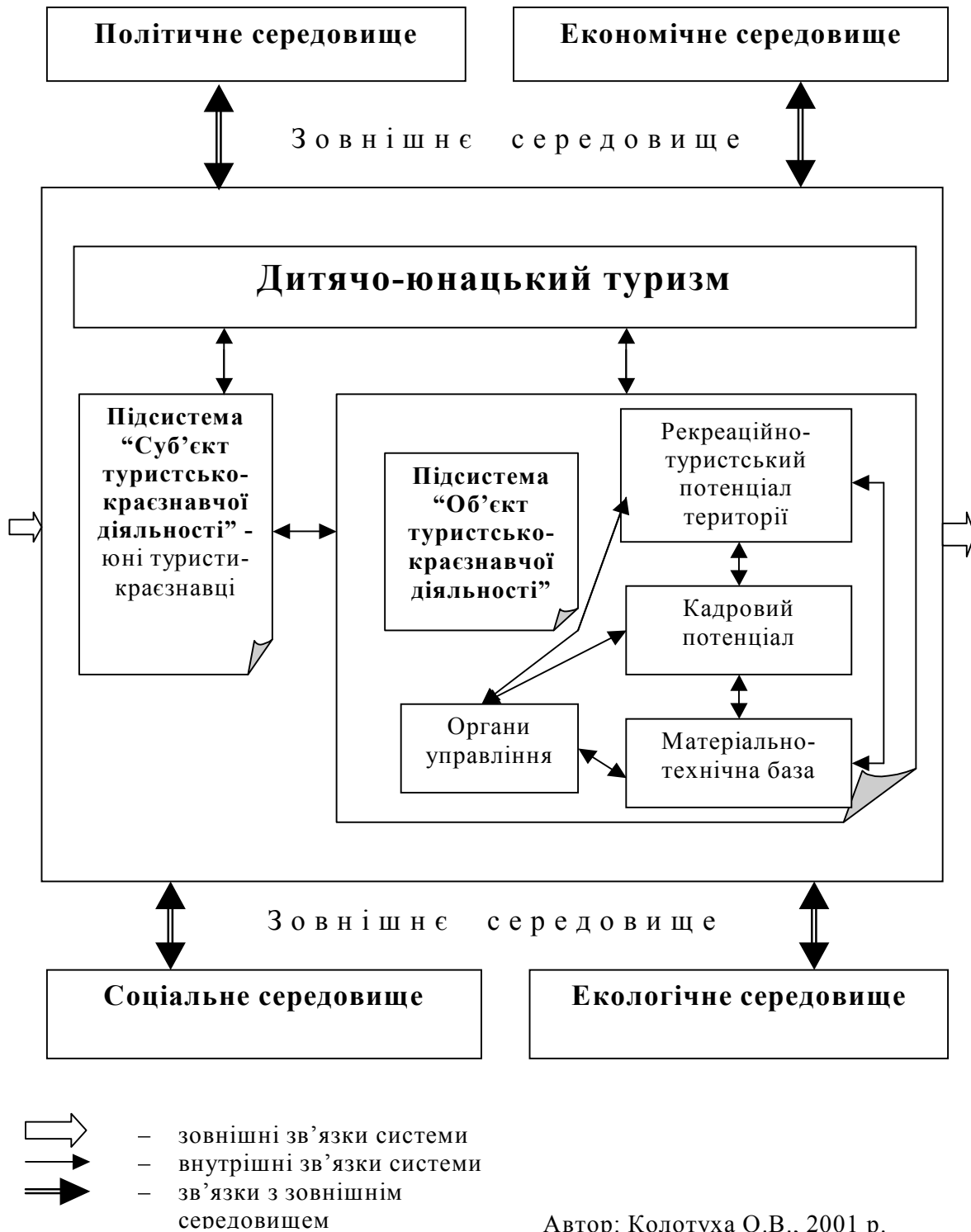
Рис. 1. Дитячо-юнацький туризм як специфічна територіальна рекреаційна система