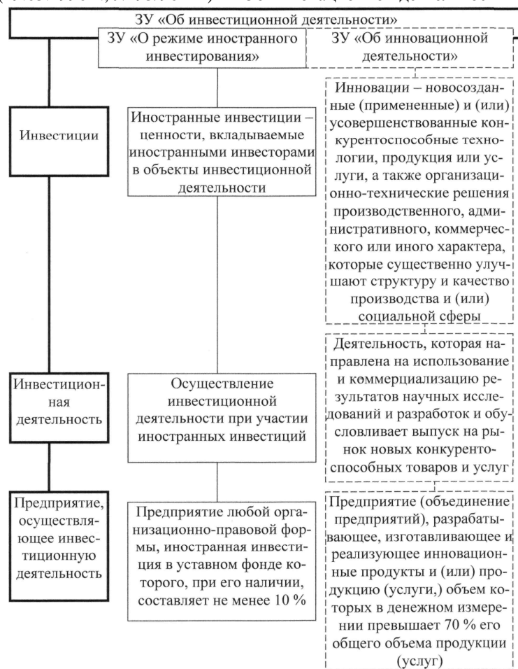
Рис. 2. Правовые основы инвестиционной деятельности в Украине

Основу правового поля в сфере инвестирования на сегодняшний день составляют Законы Украины «Об инвестиционной деятельности» (от 18.09.1991 г., № 1560-ХП), «О режиме иностранного инвестирования» (19.03.1996 г., № 93/96-ВР) и «Об инновационной деятельности» (от 04.07.2002 г., № 40-IV) (рис. 2) [1, 2, 3].