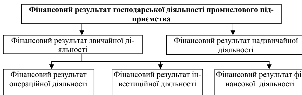
Рис. 1 Схема формування фінансового результату господарської діяльності промислового підприємства

II. Постановка задачі. Більшість сучасних досліджень в галузі посилення мотивації проектної діяльності, сила якої визначається очікуваними результатами вкладення капіталу, спрямовані на підвищення якості планування кількісних характеристик проектів, формування оптимальних проектних рішень та інше [1, с.163; 2, с.68]. З огляду на це доцільність реалізації будь якого проекту визначається показниками ефективності, наприклад, чистою дисконтованою вартістю, кінцевою вартістю капіталу або внутрішньою нормою прибутковості, які повинні мати як можна більші значення [3]. В той же час інвестиційна діяльність є однією із складових господарської діяльності промислового підприємства, кінцевий результат якої відображається багатьма показниками (рис.1).