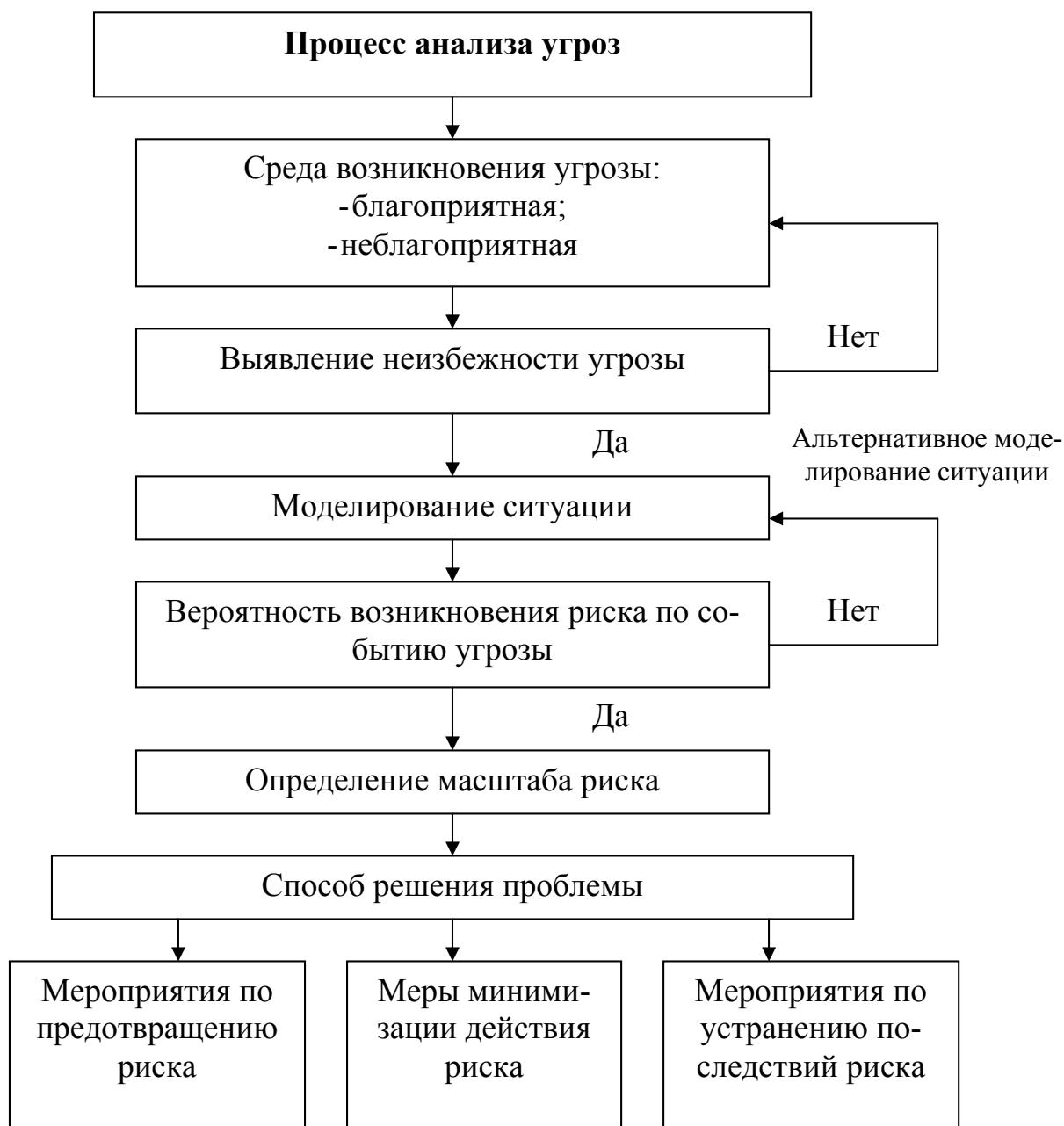
Рис. 3. Процесс анализа угроз

Процесс анализа угроз экономической устойчивости предприятий необходимо начинать с исследования среды возникновения угроз. Благоприятные условия способствуют возникновению событий, то есть совокупности факторов определяющих неизбежность угрозы. Неблагоприятные условия могут исключить возникновение событий, следовательно, нейтрализовать угрозу. Таким образом, возникает необходимость ожидания благоприятных условий для возникновения угрозы, не исключено искусственное создание благоприятных условий возникновения угрозы при ее положительных последствиях для организации. Далее необходимо выявить неизбежность угрозы. Если угроза неизбежна, моделируем ситуацию угрозы и определяем вероятность возникновения риска по событию угрозы. С угрозой связана возможность не только потери, но и выгоды, которая должна приниматься во внимание предприятием, принимающим решение. Если вероятность возникновения риска не выявлена необходимо альтернативное моделирование ситуации.