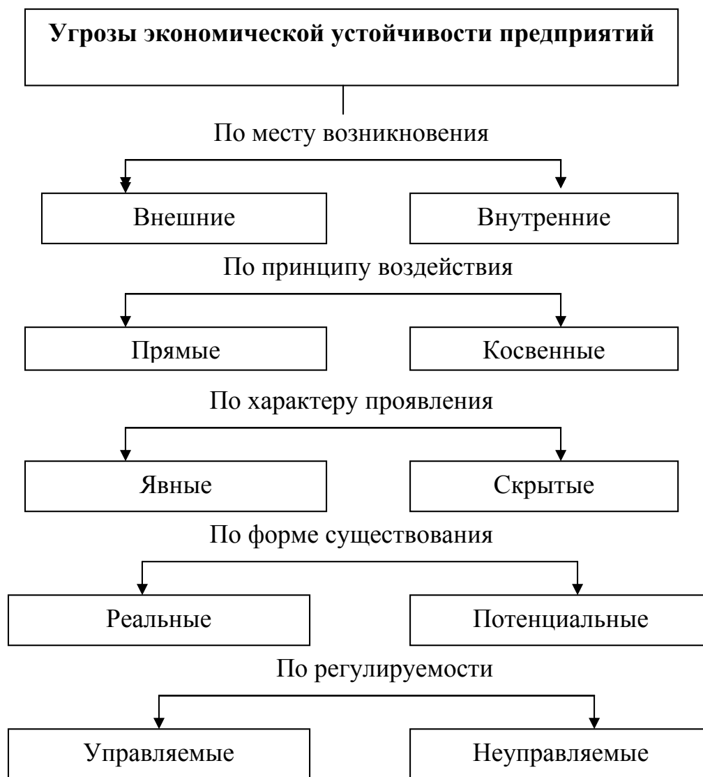
Рис. 2. Группировка угроз по степени их воздействия на экономическую устойчивость предприятия.

Приведенная выше группировка угроз, влияющих на экономическую устойчивость предприятий, может рассматриваться более детально. Рассмотренные группы угроз могут так же классифицироваться в последовательности как показано на рис. 2.