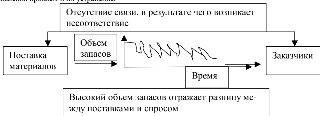
Рис.2. Организация поставок с помощью системы JIT

Система JIT рассматривает предприятие как набор проблем, мешающих эффективному выполнению операций. К числу таких проблем относятся слишком большое время выполнения заказов, нестабильность доставки заказов, не сбалансированные друг с другом операции, ненадежные поставщики, низкое качество (рис.1). Менеджеры пытаются решить эти проблемы, создавая запасы. Однако на самом деле это только скрывает причины проблем. С помощью данной системы более конструктивными действиями являются пути выявления проблем и их устранение.